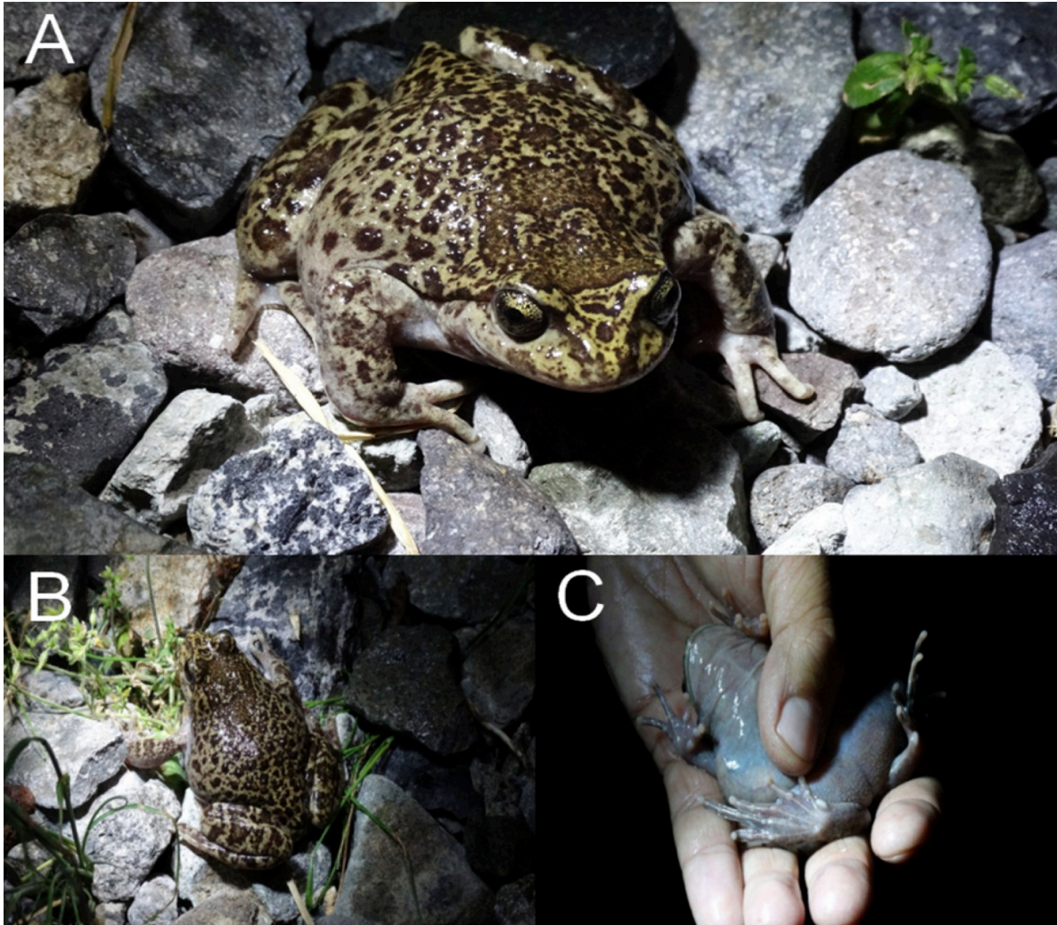
Fig. 2: A) Ejemplar adulto de Alsodes tumultuosus vista anterior-dorsal. B) Ejemplar adulto vista posterior-dorsal. C) Ejemplar adulto vista ventral.

Fig. 2: Different views for the same female adult of Alsodes tumultuosus reported in the present study. A) Anterodorsal view. B) Posterodorsal view. C) Ventral view.