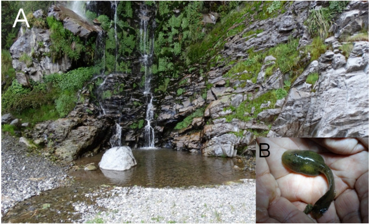
Fig. 3: A) Hábitat donde fue encontrado Alsodes tumultuosus . B) Larva de Alsodes tumultuosus .